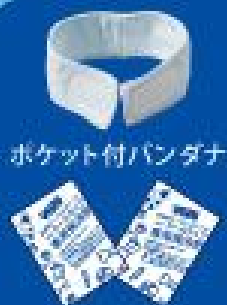
ポケット付バンドナ