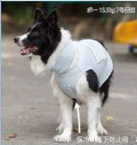
※ 15.5kg 7号着用