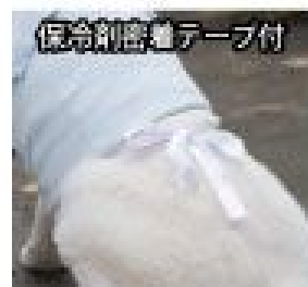
保冷剤着脱テープ付

6.7&10.12号はポケットに保冷剤を入れた時の痛みによる保冷剤の落下を防止するため服の内側に背中・純ぶテープがついています。この不要の場合はカットしてください。