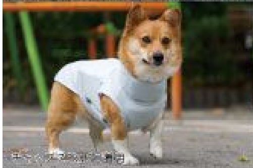
ポニー 15.8kg 2号着用