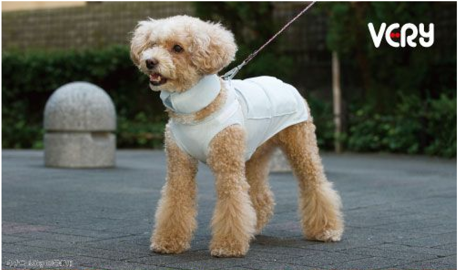
ポニー 15.8kg 2号着用