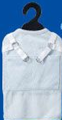
ポケット付ウェア