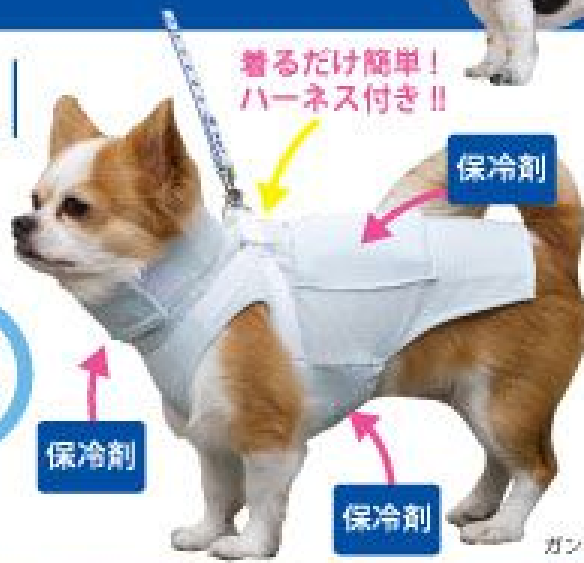
ガンモ 3.1kg 2号着用