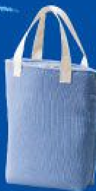
専用お散歩保冷バッグ