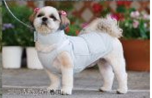
ポニー 15.8kg 2号着用