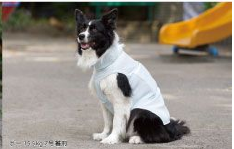
ポニー 15.8kg 2号着用