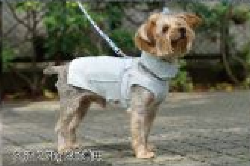
ポニー 15.8kg 2号着用