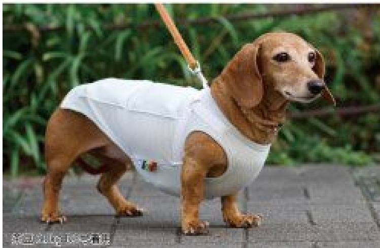
ポニー 15.8kg 2号着用