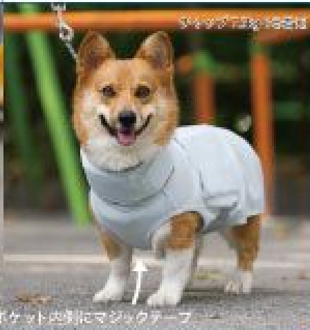
※ 7.2kg 6号着用